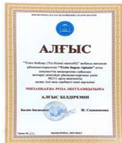
Тілге бойлау(Тіл білімі мектебі) жобасы аясында ұйымдастырылған “Тілім барда тірімін” атты әлеуметтік видеоролик сайысын жоғары деңгейде ұйымдастырғаны үшін