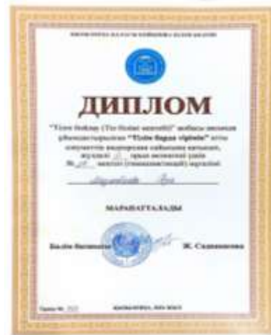
Тілге бойлау(Тіл білімі мектебі) жобасы аясында ұйымдастырылған “Тілім барда тірімін” атты әлеуметтік видеоролик сайысында жүлделі ІІ орын иеленгені үшін