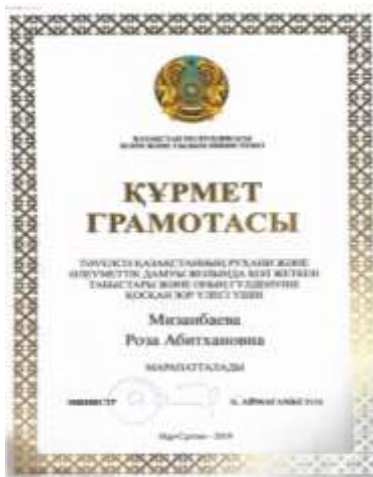
Қазақстан Республикасы Білім және Ғылым Министрлігі Құрмет грамотасы