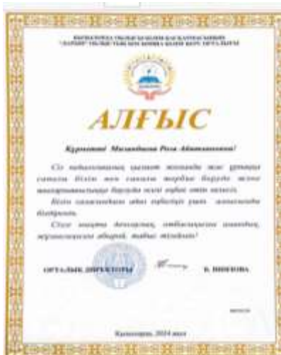
Қызылорда облысы әкімінің Алғыс хаты